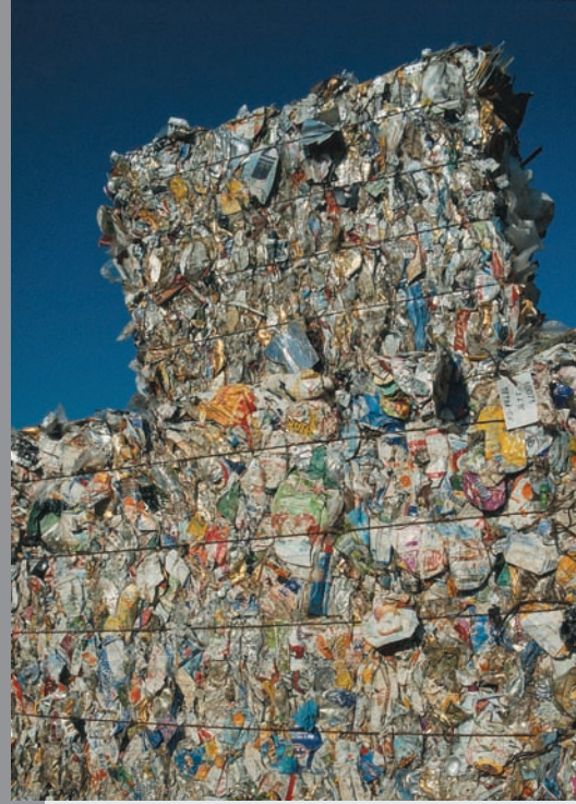
Ayrılmış ve değerlendirme için pres edilmiş plastik ambalajları